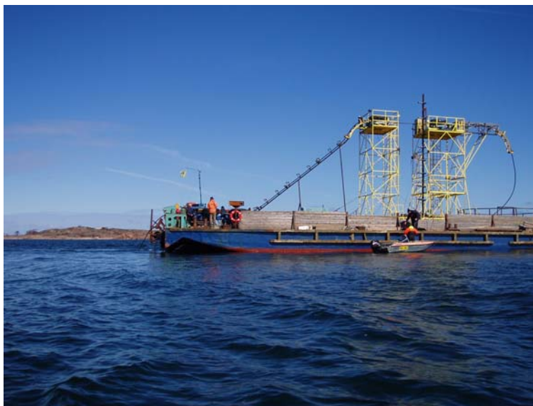
Läggning av 45-kV kabel från Lilla Båtskär till Lervik i Mariehamn

Under år 2007 har andelslaget sålt elcertifikat till åländska kunder samt till Fortum i Finland.