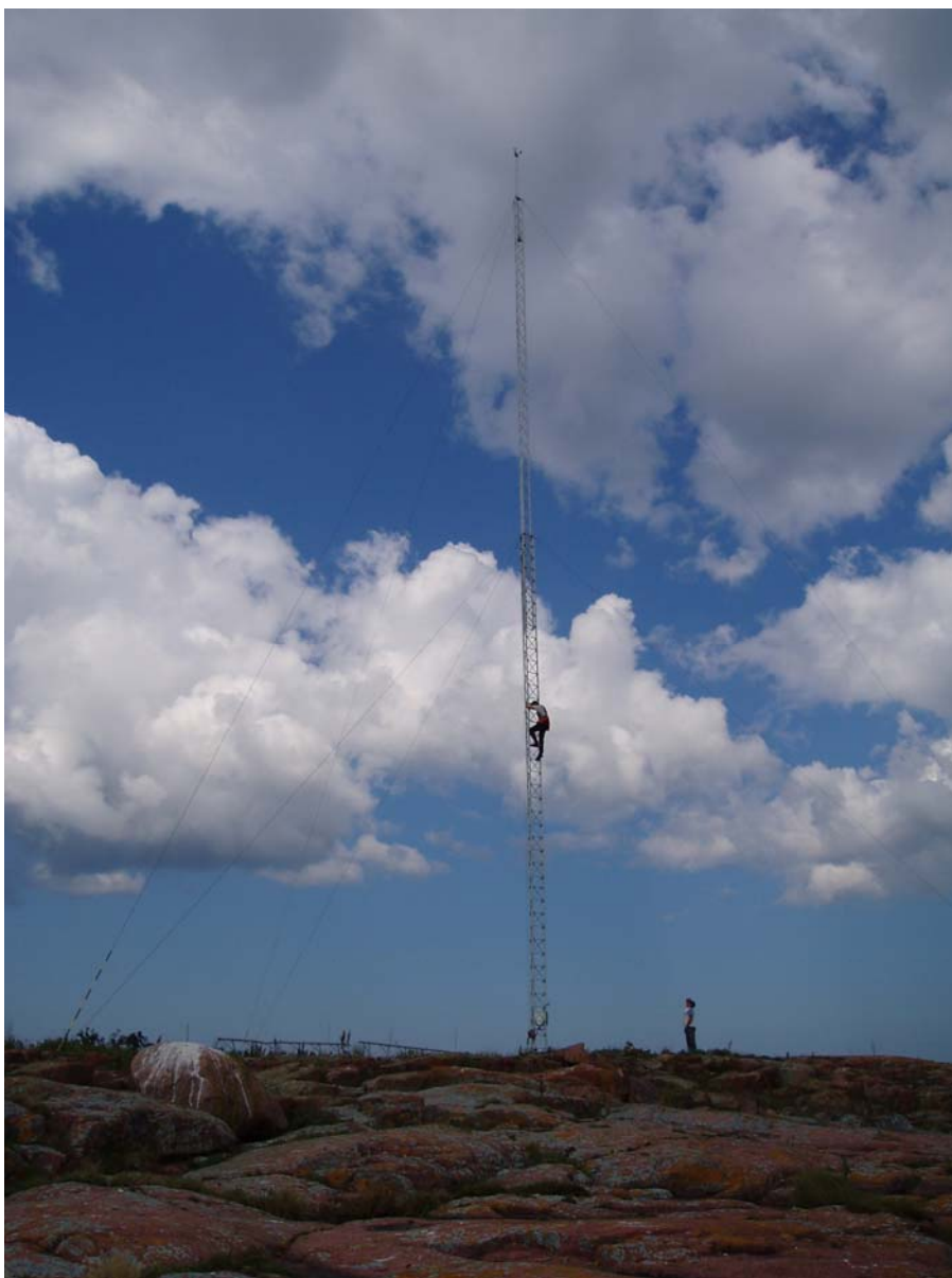
Montering av mätmast för Ålands Elandelslag på Vätingen i Hammarland.

Styrelsen föreslår att årets överskott på 54 514,56 € användes så att 24 €/andel i ränta på andelskapital utdelas till 2239 andelar enligt ovan, sammanlagt 53 736 € och resterande 778,56 € överförs till balanserande vinstmedel.