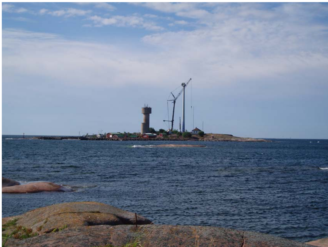
Montage av vindkraftverket Trefanten på Lilla Båtskär

* Fortuna o Frans var delvis ur drift pga. defekta växellådor