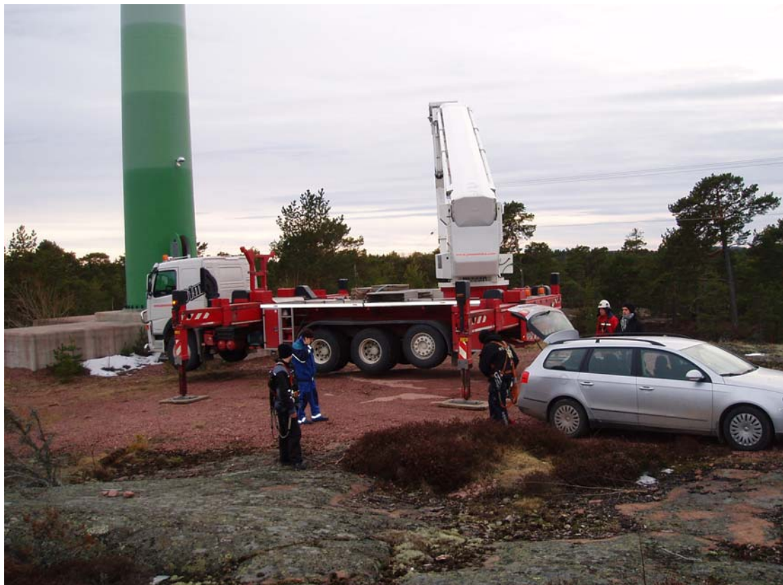
Vingbesiktning i Pettböle, Finström.

**Fortuna o Frans var delvis ur drift pga defekta växellådor.