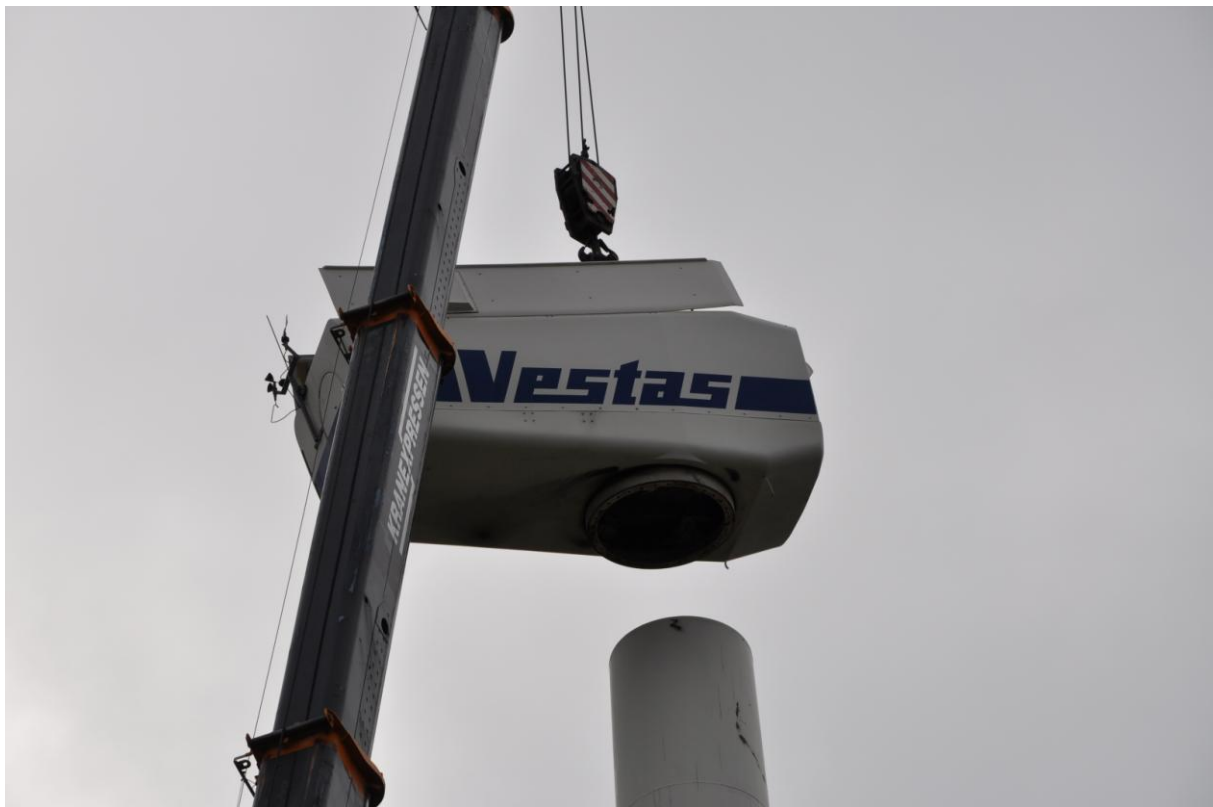
Nedmontering av vindkraftverket Vinghals i Sottunga, augusti 2010.