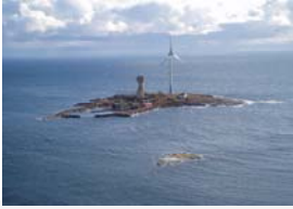
Trefanten på Lilla Båtskär.