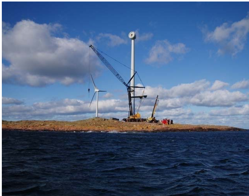
Montage av vindkraftverket Anna på Kummelpiken.